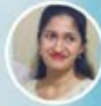
ಅಲ್ಲಯಾಲ್ ವೆಳ್ ಪಲವ್ನ್ ವೆಲೆ