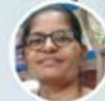
ಮಾನೆಸ್ತೆಗ್ ಪ್ರಸಿಲ್ಲಾ ಥಾವ್ನ್ ಉಪ್ಕಾರ್ ಅಮ್ಮೊಡಿ