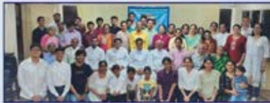
ಸಾಂಜೆಜಾ ವೆಳಾರ್ ಸಾಂಸ್ಕೃತೀಕ್ ಕಾರ್ಯಂ