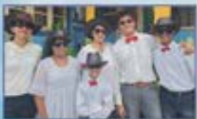
ಪರಿತಾ ಆನಿ ವನಿತಾ ಪಂಗ್ಡಾ ಥಾವ್ನ್ ನಾಬ್.