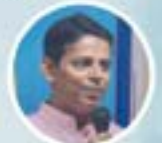
ಬಾ. ಪ್ರವೀಗ್ ಅಯೋ ಲಸ್ತಾದೊ ಥಾವ್ನ್ ಸಂದೇಶ್