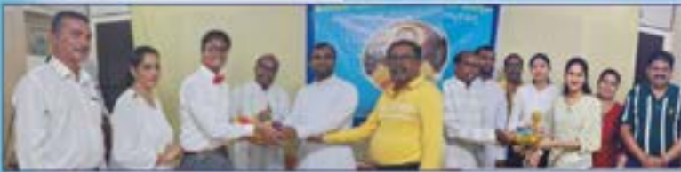
ಶಿಕ್ವಾ ಪೆತಾಂತ್ ಉಕ್ತೀಗ್ ಜಾಲ್ಲ್ಯಾ ರೇಯ್ಡರ್, ಆನಿಕಾ, ಅಲ್ಲಯ, ಪಾಂಕಾ ಮಾನ್ ಕೆರೊ