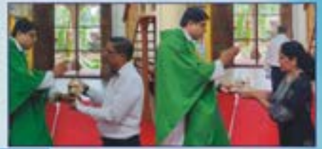
ವಾಡ್ಯಾಗಾರಾಂನಿ ದಿಸಾಚಿ ಅಮರ್ಜ ಪಲವ್ನ್ ವೆಲೆ