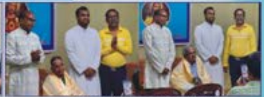
ಮಾನೆಸ್ ಪೊರಿಸ್ ಮೊಂತೇರೊ ಆನಿ ಮಾನೆಸ್ತೆಗ್ ಶ್ವೆಲ್ಲಾ ಕ್ರಾಸ್ತಾ ಪಾಂಕಾಂ ನನ್ಯಾನ್