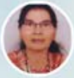
ಮಾನೆಸ್ತೆಗ್ ಅಲ್ಲಾ ಫೆರ್ನಾಗೊನಿ ಥಾವ್ನ್ ವಾಡಿಗ್ ವೆದಿಗ್