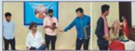
ಗ್ಲಾಡ್ಡಮ್ ಬ್ರದರ್ಸಾ ಥಾವ್ನ್ ಸಾಬ್ಜುಟೊ