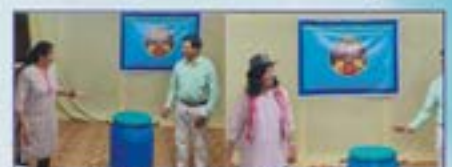
ವನಿತಾ ವಿಲಯಂ ಆನಿ ಎಲಾಜಾಬೆತ್‌ಹಾಂಟ್ ಥಾವ್ನ್ ಸಾಬ್ಜುಟೊ