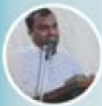
ಬಾ. ಕ್ಲಾಸ್ಸಿ ದಿಸೋಣಾ ಥಾವ್ನ್ ಸ್ವಾಗತ್