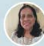
ಮಾನೆಸ್ತೆಗ್ ಎಲಾಜಾಬೆತ್ ರೋಜ್ ಕಾರ್ಯಾ ನಿರ್ವಾಹಕ್